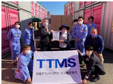
<提供・譲渡合意書取り交わしの様子>

また、翌週11日（金）には横浜市内でフードバンク活動を行っている「NPO 法人フードバンク横浜」へ非常食を寄贈し、NPO 法人フードバンク横浜の倉庫へ搬入もあわせて行いました。12月3日（土）には横浜市の山下公園前にあるビル内で行われた『頑張るママ応援イベント（ひとり親支援イベント）』の食材配布活動にも参加しました。