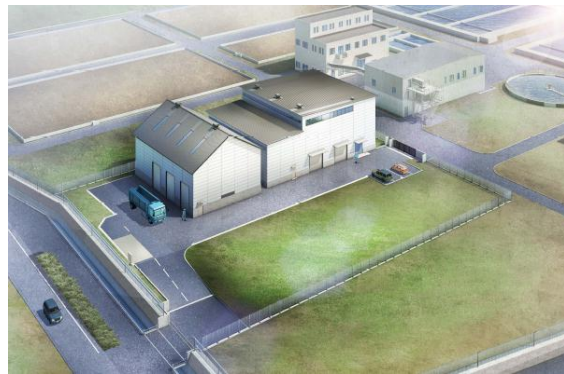
尾張西部浄水場 脱水設備 完成予想図