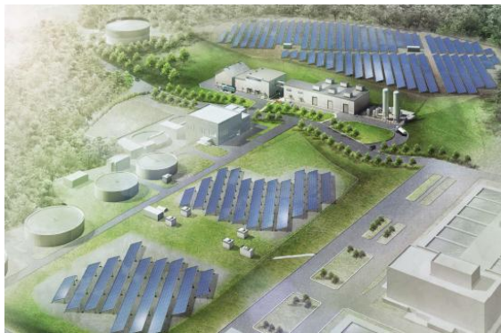
犬山浄水場 脱水および発電設備 完成予想図

尾張W&Eは、2017年3月末までに施設を設計・建設し、2017年4月から2037年3月末までの20年間にわたり同施設の運営・維持管理を行っていく予定です。